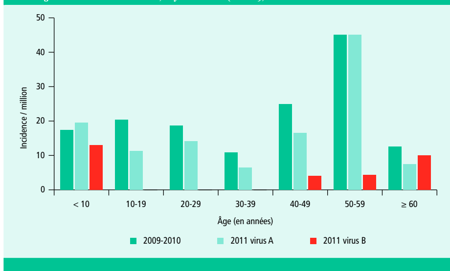
Figure 1 Incidence des grippes sévères par tranche d'âge et par année selon le type de virus grippal, Pays-de-la-Loire (France), 2009-2011 / Figure 1 Incidence of severe influenza cases by age group and per year according to the viral influenza strain, Pays-de-la-Loire (France), 2009-2011