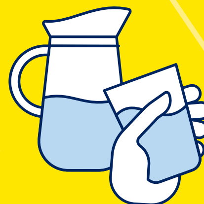
BUVEZ DE L'EAU