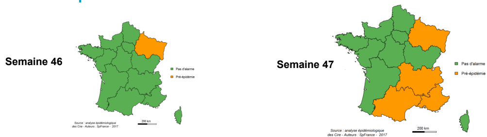
Figure 1– Niveau d'alerte régional pour les GEA en semaines 46/2017 et 47/2017, France métropolitaine

Santé publique France s'appuie sur un réseau d'acteurs pour assurer la surveillance des GEA : médecins libéraux, urgentistes, Centre national de référence, et épidémiologistes