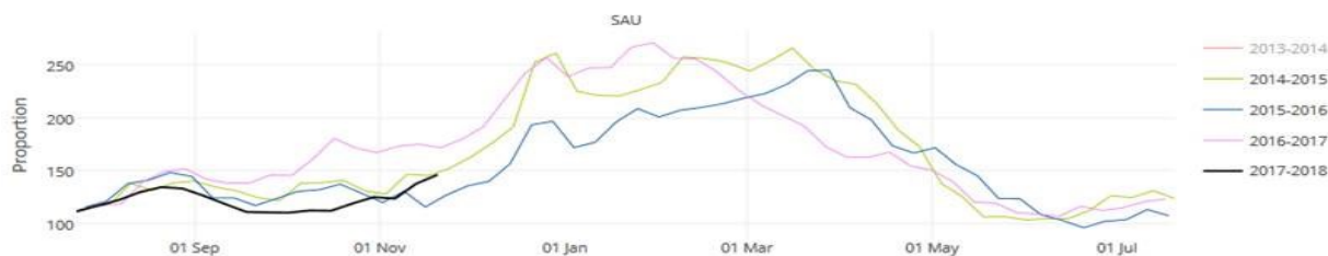
Figure 3 –Évolution hebdomadaire des proportions de GEA parmi les actes codés aux urgences hospitalières, septembre 2013—novembre 2017, données du réseau Oscour au 28 novembre 2017

En semaine 47, la part d'activité des services d'urgence hospitaliers pour gastro-entérite aiguë (GEA) est en augmentation, inférieure à l'activité observée à la même période en 2016-2017, et supérieure à celle observée en 2015-2016 à la même période (Figure 3).