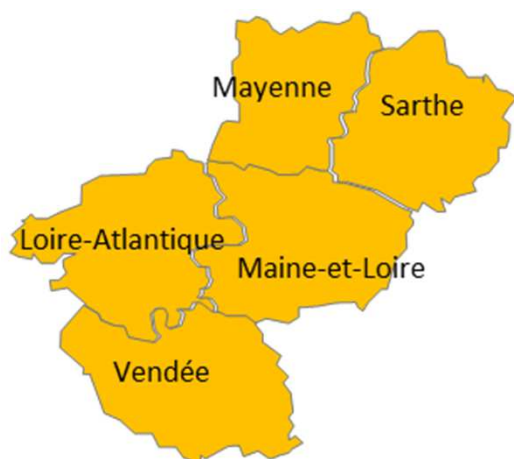
Figure 1 : Carte régionale des niveaux de vigilance canicule départementaux en région Pays de la Loire