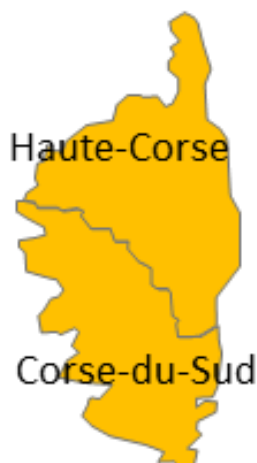
Figure 1 : Carte régionale des niveaux de vigilance canicule départementaux en région Corse (Source : Météo France, carte de vigilance du 05/08/17 à 16h)