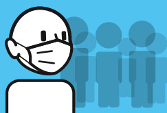
Portez un masque lorsqu'il y a du monde ou si vous êtes malade