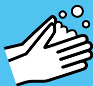
Lavez-vous les mains