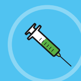
Vaccin contre la grippe, covid et certaines gastro-entérites

Pour les enfants ou personnes fragiles, si vous êtes malade, il faut voir un médecin. S'il n'est pas disponible, appelez le 15