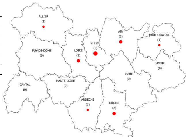
Répartition par département des épisodes d'intoxication au monoxyde de carbone pour la période de chauffe 2017-2018 depuis le 1 er octobre 2017 (2017-S39) en Auvergne-Rhône-Alpes - Siroco®, Santé publique France