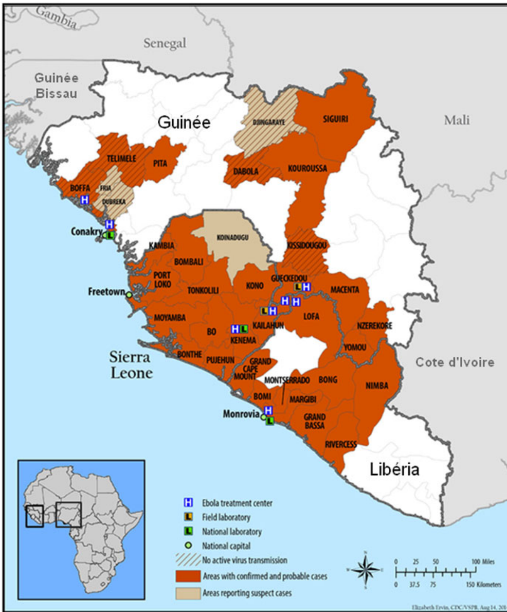
Carte. Epidémie de fièvre Ebola en Afrique de l'Ouest (CDC, adaptée InVS – MAJ le 26/08/2014)