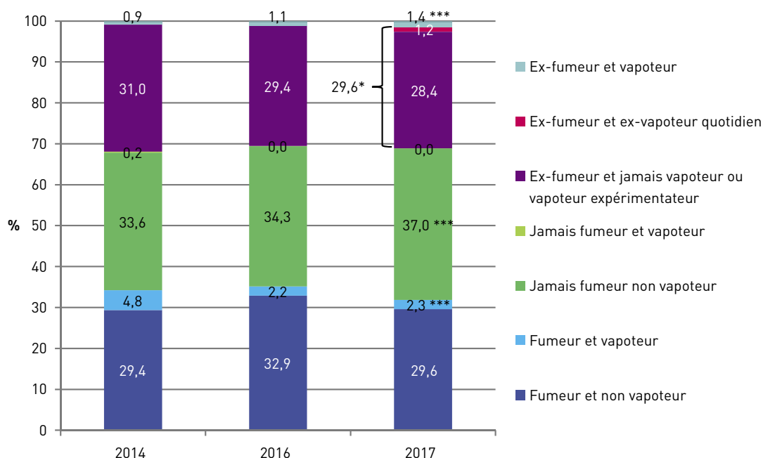
FIGURE 2 | Structure de la population des 18-75 ans par rapport au tabagisme et au vapotage actuel en 2014, 2016 et 2017

Les * indiquent une évolution significative entre 2014 et 2017 : *** p<0,001.