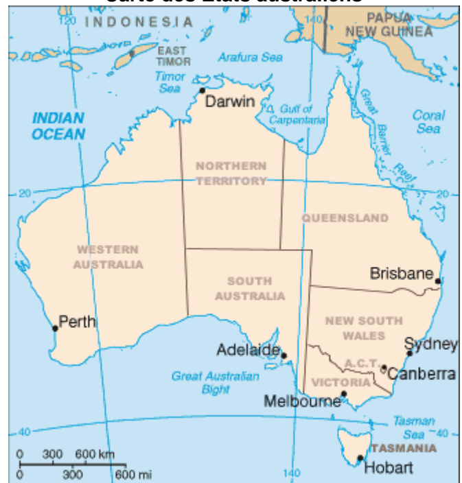
Carte des Etats australiens