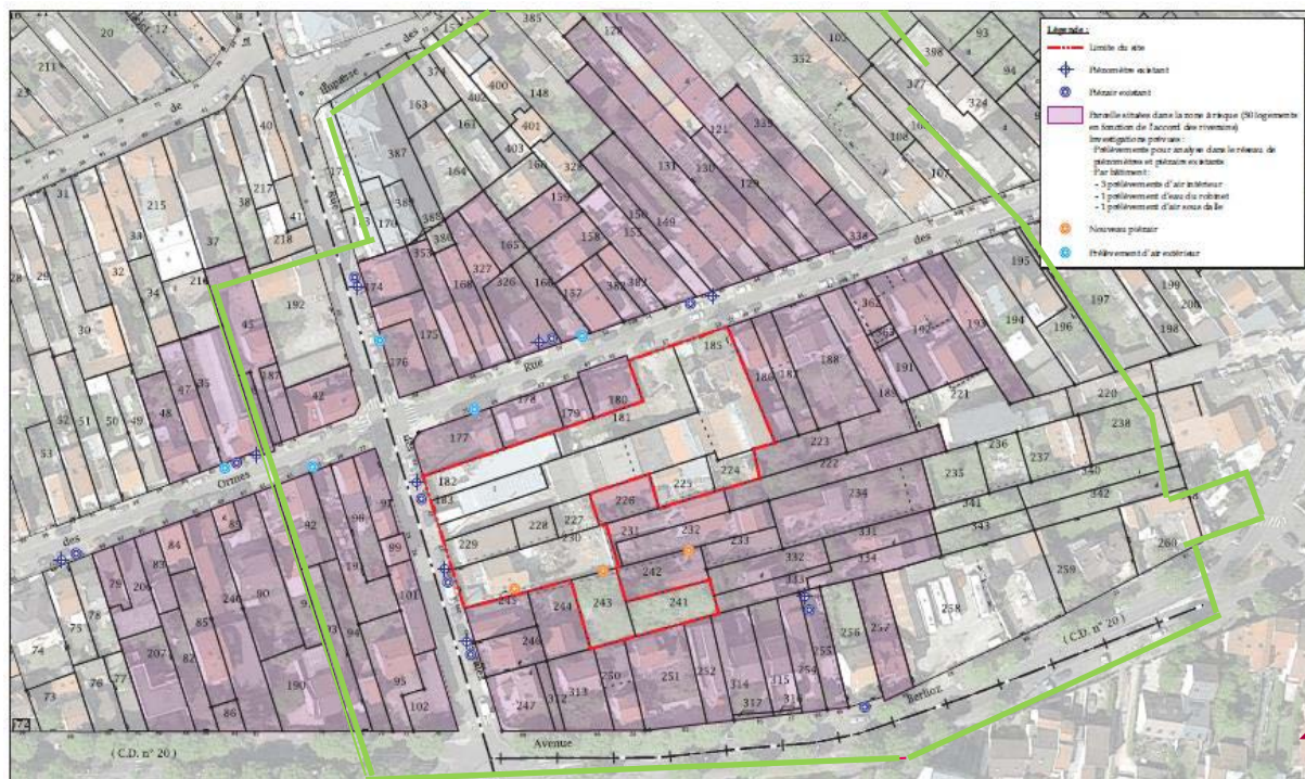
Plan de la zone d'étude

Légende : Parcelles concernées par les analyses environnementales Emplacement de l'usine Wipelec Zone de l'enquête en porte à porte